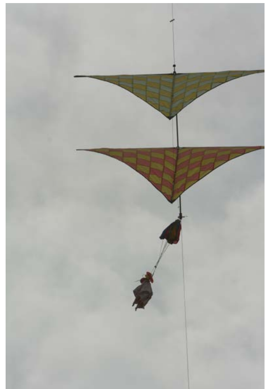
Boodschapper van Victor Rinia

Met sportieve vlieger groet, Stichting Rijsbergse Vliegerdagen info@rijsbergsevliegerdagen.nl