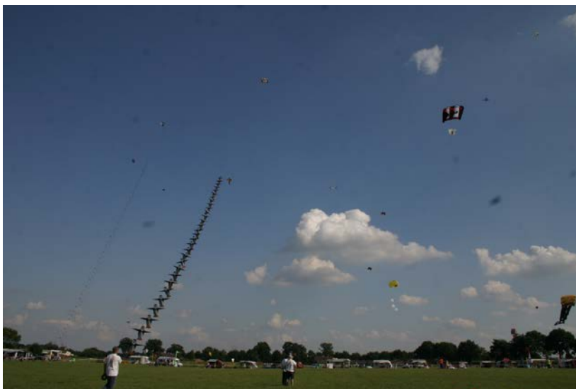
1e Rijsbergse Vliegerdagen 2009

Ook kun je je per email aanmelden, mail even naar info@rijsbergsevliegerdagen.nl , ook afmelden kun je op dit emailadres. In deze nieuwsbrief houden we je op de hoogte van de Rijsbergse Vliegerdagen maar ook nieuwtjes en informatie uit de vliegerwereld kun je hier verwachten. Ook stellen we een aantal mensen van de Rijsbergse Vliegerdagen voor. Uiteraard is deze nieuwsbrief geheel gratis.