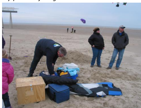
En dan weer opruimen