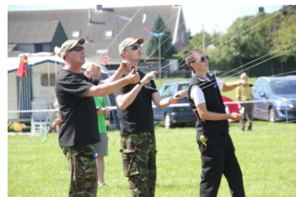
The North East Kite Flyers

Met sportieve groet, Stichting Rijsbergse Vliegerdagen info@rijsbergsevliegerdagen.nl