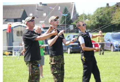
The North East Kite Flyers

Met sportieve groet, Stichting Rijsbergse Vliegerdagen info@rijsbergsevliegerdagen.nl